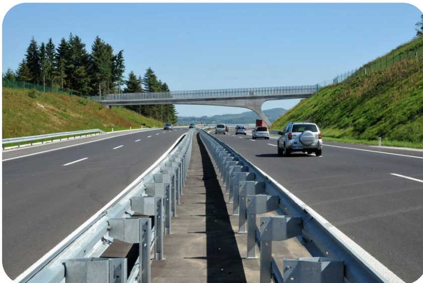
Video posnetek avtocestnega odseka si lahko ogledate tukaj .