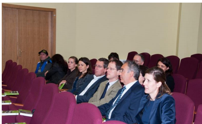
Regionalni center za razvoj Zasavje