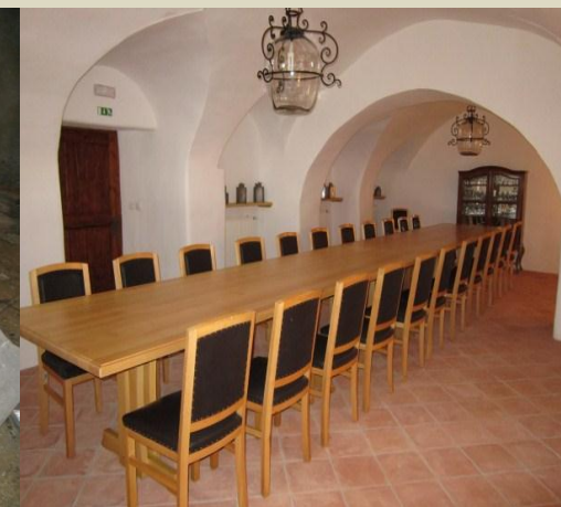
Strmolska dvorana po obnovi