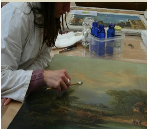
Konservatorsko restavratorski posegi