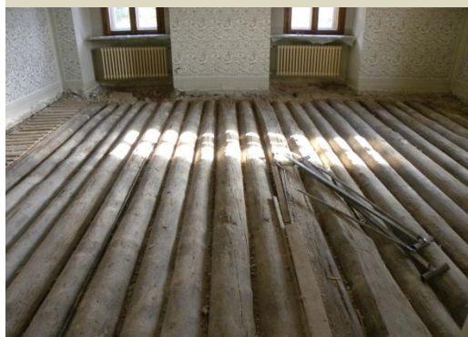
Radov salon med obnovo