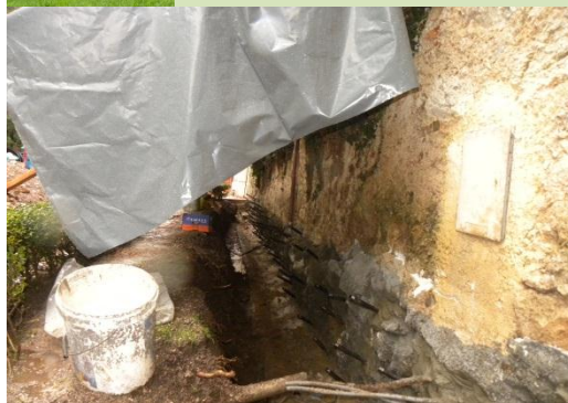
Statična sanacija temeljev gradu