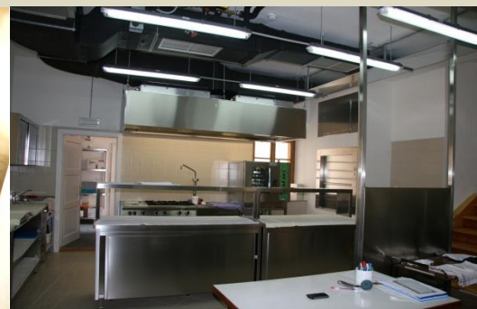
Grajska kuhinja po obnovi