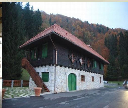
Gostinski objekt po obnovi