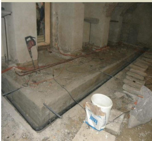
Strmolska dvorana med obnovo

Dostop do gradu je ostal nespremenjen, pred gradom pa se je uredilo manjše parkirišče s sedmimi parkirnimi mesti. Po zaključku sanacije hudournika se je uredilo tudi novo parkirišče ob kavarni, ki lahko sprejme 30 osebnih vozil in dva avtobusa. Proste površine okrog parkirišč so zatravljene in zasajene z drevesi z gosto raslo krošnjo. Delno je bil urejen tudi park gradu Strmol.