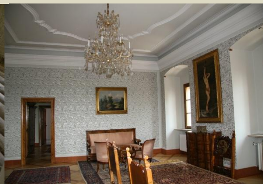
Radov salon po obnovi