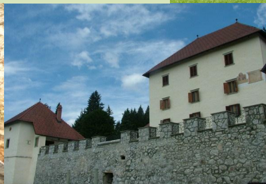
Grad po obnovi