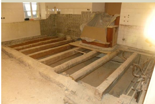
Grajska kuhinja med obnovo