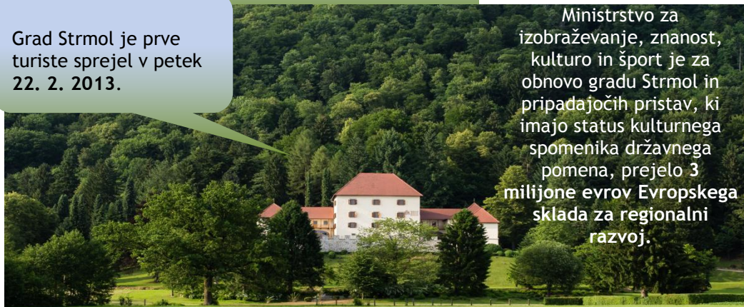
Grad Strmol po končani obnovi junija 2012

Ministrstvo za izobraževanje, znanost, kulturo in šport je za obnovo gradu Strmol in pripadajočih pristav, ki imajo status kulturnega spomenika državnega pomena, prejelo 3 milijone evrov Evropskega sklada za regionalni razvoj.