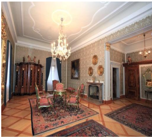
Zlati salon poimenovan Josipin salon