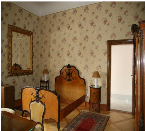
Ksenjina spalnica po obnovi