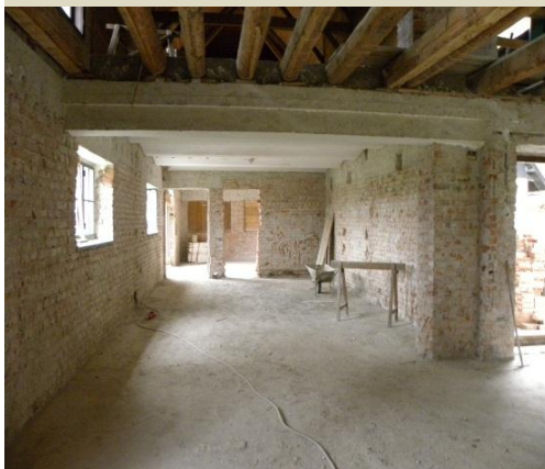
Bivalni objekt preurejen v gostinski objekt