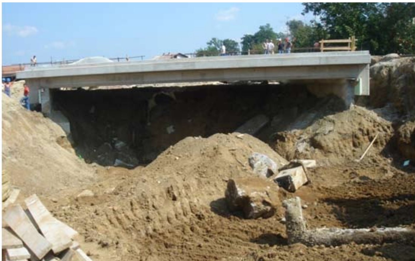
Gradbišče v začetku septembra 2009