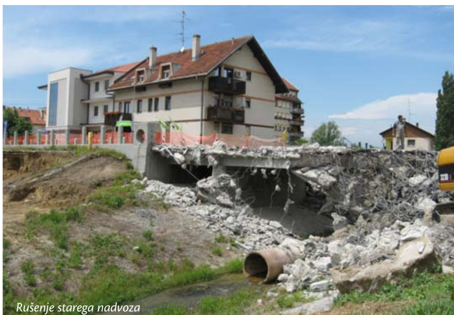
Rušenje starega nadvoza

Slovenija si je na podlagi Operativnega programa razvoja okoljske in prometne infrastrukture izpogajala dobre 1,6 milijarde evrov sredstev, ki so v prvi vrsti namenjeni za posodobitev ali novogradnjo infrastrukture s področja okolja in prometa. Omenjeni program je podlaga za črpanje zlasti iz Kohezijskega sklada (KS), in sicer v višini dobre 1,4 milijarde evrov, v manjši meri, in sicer v višini 224 milijonov evrov, pa iz Evropskega sklada za regionalni razvoj (ESRR).